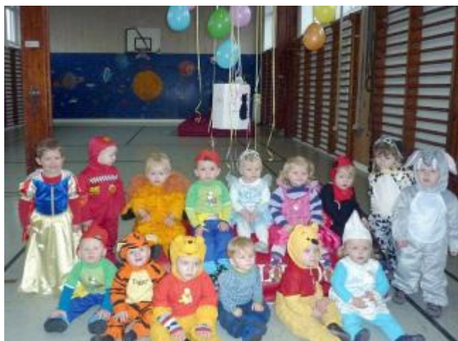
Dagplejebørnenes fastelavn. Børnene havde selv malet tønden